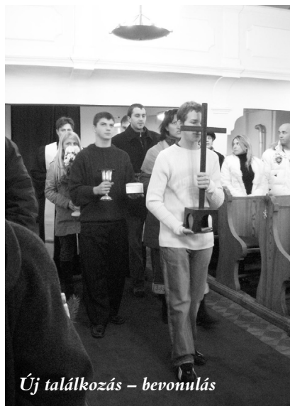
Új találkozás – bevonulás

pasztalet, hogy ezekre az alkalmakra egyre kevesebben jönnek el, így a jövőben nagyobb gondot kell fordítani a szervezésre. Fehér asztal mellett beszélgettünk a „Magunkról – magunknak” című gyülekezeti nyári összejevetelen, amelyet a szabad levegőn tartottunk júniusban. Örömteli eseménye volt az elmúlt esztendőnek a karácsonyi istentisztelete, amelyet a Magyar Rádió élő egyenes adásban közvetített. Ez az istentisztelet megmozgatta az egész gyülekezetet. A liturgiai és zenei szolgálatban többen részt vállaltak, így sokan érezhették úgy, hogy részesei lehetnek egy közös nagy ünnepnek. Sok pozitív visszajelzés érkezett erről az istentiszteletről.